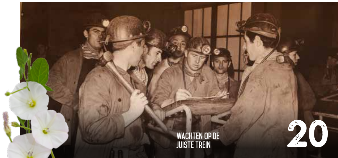
WACHTEN OP DE JUISTE TREIN

Je kan OKRA-magazine ook lezen via www.okra.be .